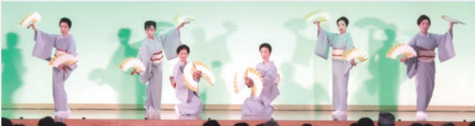
令和5年度合同作品 祝舞「祝いめでた」