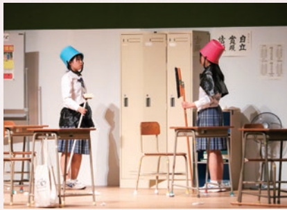
日田三隈高等学校 「19時過ぎの教室で」