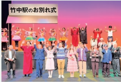
4月の舞台公演から