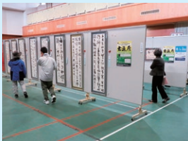
書道展 佐伯会場 (三余館)

第56回大分県美術展本展終了後、選抜作品を県内18地域で巡回展示する。詳細は裏表紙。写真は、第55回巡回展から。