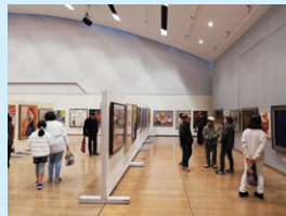
日洋彫工部会 中津会場 (中津市小幡記念図書館)

主催: 大分県美術協会 大分県民芸術文化祭実行委員会 ほか 問合せ: 097-541-3316 (池部)