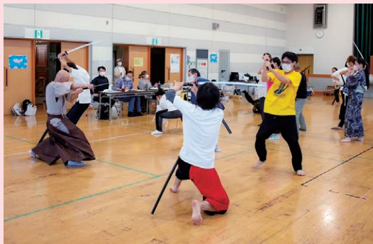
公民館での 練習風景