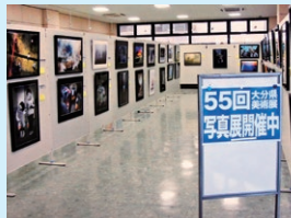
写真展 杵築会場 (きつき生涯学習館)