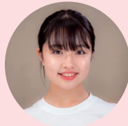
闇千代少女時代 りり