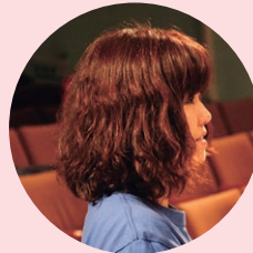
作・演出 佐倉吹雪

戦国時代。雷神と恐れられた豊後の名将立花道雪。そのひとり娘闇千代は幼くして立花城の城主となる。西国一の美姫とうたわれた闇千代は武芸にも秀で自ら鉄砲隊を結成し城の護りにあたった。そんな闇千代が婿を迎えたのが豊後の風神高橋紹運の嫡男・統虎、のちの宗茂であった。順風満帆に見えた二人の生活にやがて訪れる騷り。闇千代、宗茂の行く末は…!?