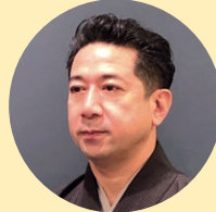
日本舞踊家 花柳 龍知郎